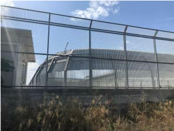
Umzäunung der Abschiebungshaft - Archivfoto

für Inhaftierte geschickt, der einen Besuch in der Einrichtung in Trapani geplant hat.