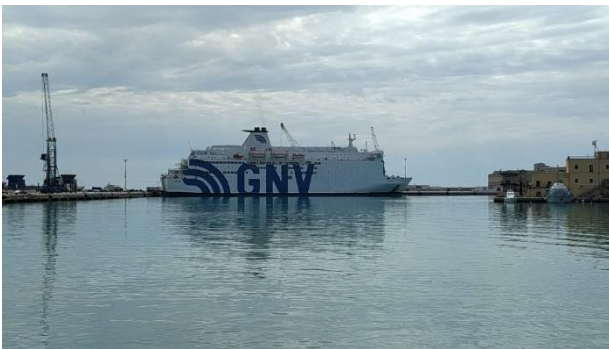
Quarantäneschiff in Porto Empedocle

Trotz der Aufhebung des Ausnahmezustands in Italien Ende März wurden die seit fast zwei Jahren betriebenen Quarantäneschiffe zur Isolierung der an der sizilianischen Küste ankommenden Migrant*innen bis Anfang Juni weiter eingesetzt. Borderline Sicilia setzte wie in den Vorjahren die Arbeit zur Überwachung der Vorgänge an Bord und des Verbleibs der dort unter Quarantäne gestellten Personen fort.