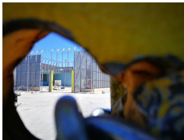
CPR Trapani Milo

Januar/Dezember: Nach dem Treffen mit den tunesischen Müttern von Vermissten im Oktober 2021 in Palermo haben wir in Zusammenarbeit mit Alarm Phone, Cledu Palermo, Carovane Migranti, borderline-europe, LasciateCIEntrare, Melting Pot ein Unterstützungsnetz für Familienangehörige , die nach ihren Angehörigen suchen, eingerichtet, um die Verfahren zur Erkennung und Rückführung der Leichen zu erleichtern. Das Projekt des Netzes heißt Mem.Med und hat bereits 22 Fälle von Vermissten im Mittelmeer behandelt.