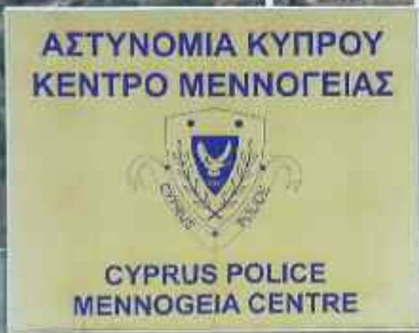
► POLIZEI-STATION IN NIKOSIA