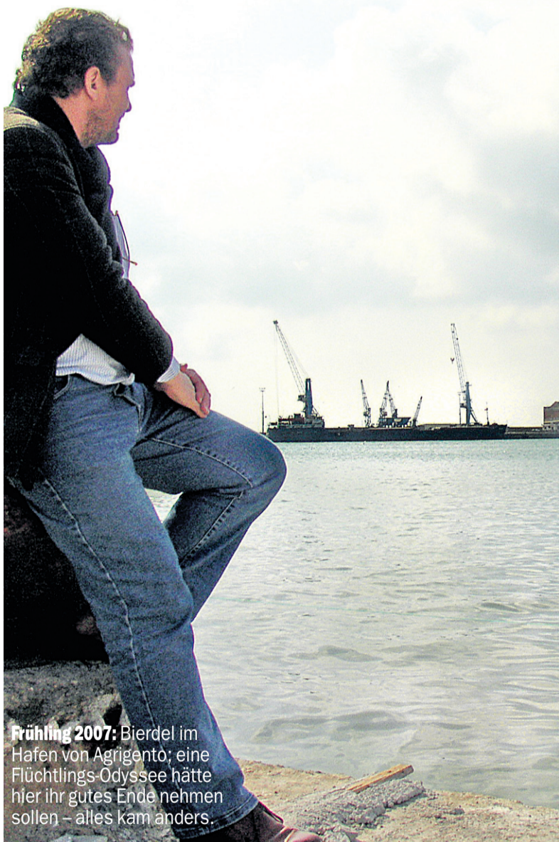
Frühling 2007: Bierdel im Hafen von Agrigento; eine Flüchtlings-Odyssee hätte hier ihr gutes Ende nehmen sollen – alles kam anders.

Die Autorin ist Innenpolitik- Ressortleiterin der „Presse“.